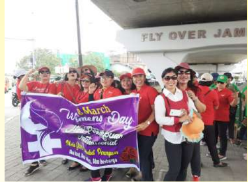
Pemberian setangkai bunga aksi kasih dalam rangka hari Perempuan Internasional di Medan