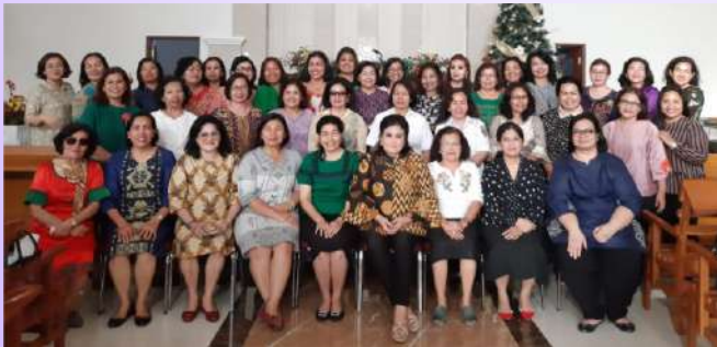
Penyerahan SK Tugas Kepada Panitia Mupel Moria GBKP 2020 di GBKP Setia Budi Medan