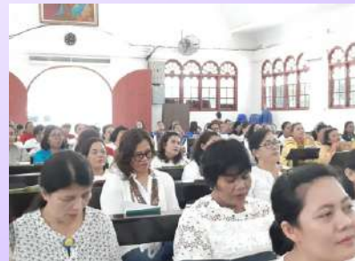
Sosialisasi BPAM masih dilaksanakan di gereja awal februari 2020