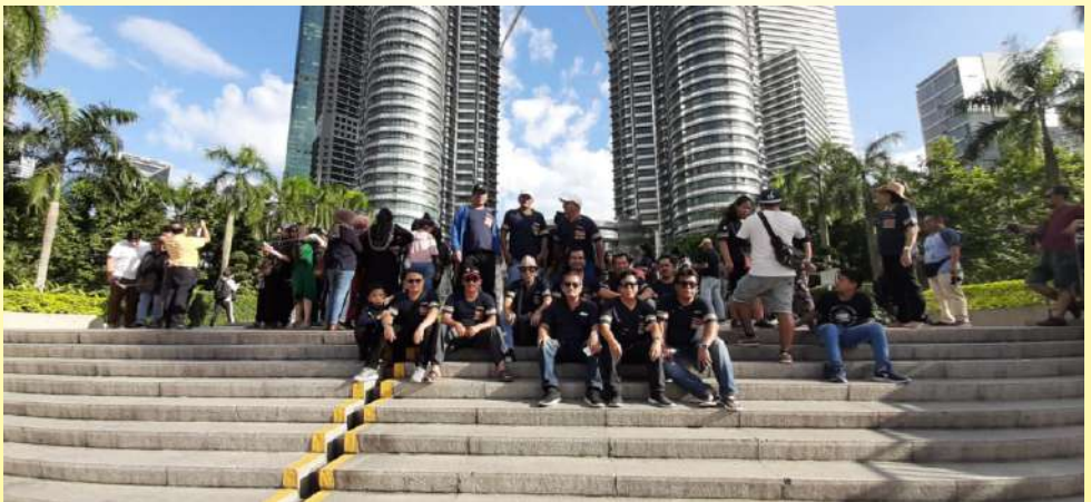
Keluarga BPP Moria Dalam Retreat Keluarga di Kuala Lumpur