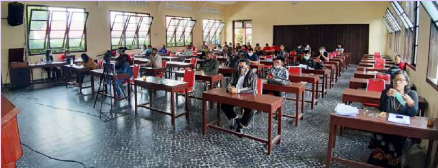
Jaringan Solidaritas Peduli Pilkada Karo diselenggarakan di Centrum Kabanjahe