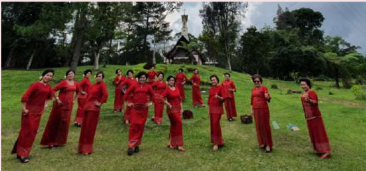
BPP Moria GBKP Menyanyikan Mars Moria GBKP di Retreat Centre Suka Makmur