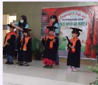
Wisuda Perdana TK Bintang Moria di KWK Berastagi